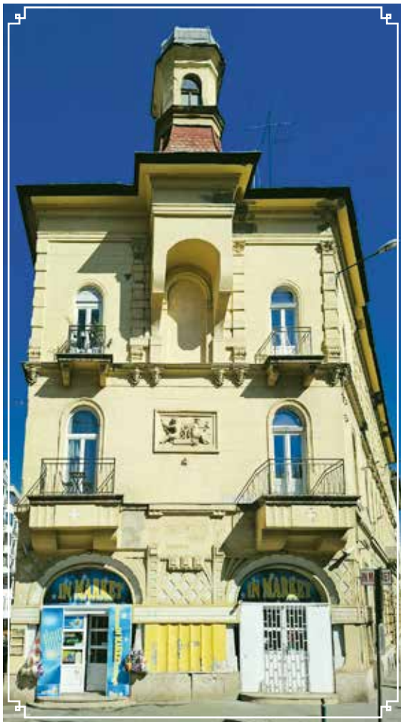
A ház homlokzata a Szilágyi Erzsébet fasor felől

Az idén 136 éves sarokház elkerülhetetlenül látóterünkbe kerül, ha a Szilágyi Erzsébet fasoron a Széll Kálmán tér és a Krisztina körút felé haladunk. Egy tornyocska és egy üzletportál feletti dombormű a megmaradt díszei. A domborművön két puttó látható, az egyik mérleget, a másik Hermész botját tartja a kereskedelem szimbólumaiként.