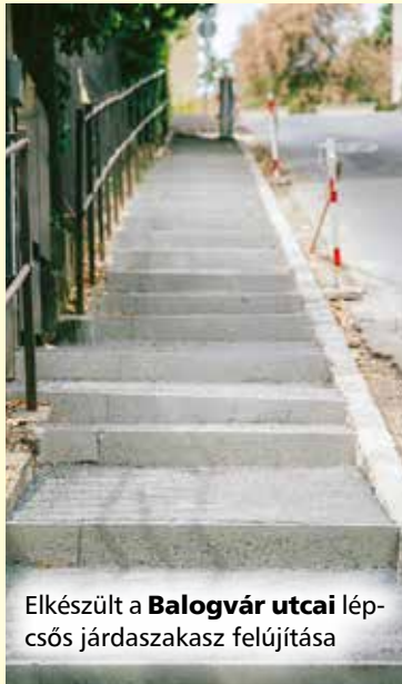
Elkészült a Balogvár utcai lépcsős járdaszakasz felújítása