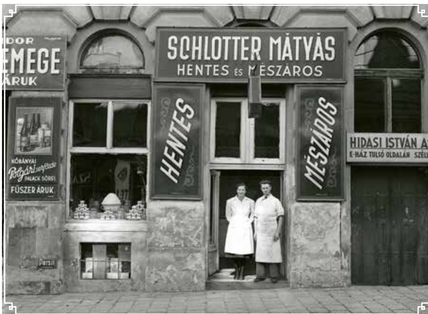
A Retek utca 36.-ban hentesüzlet működött a II. világháború előtt