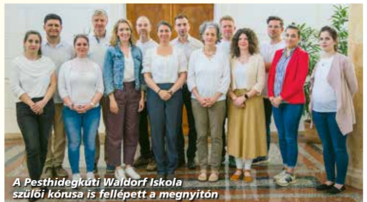
A Pesthidegkúti Waldorf Iskola szülői kórusa is fellépett a megnyitón