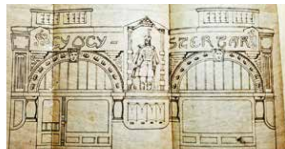
A Széchenyi Istvánhoz címzett patika portáljának tervrajza