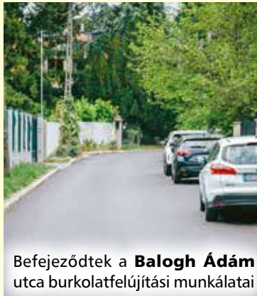
Befejeződtek a Balogh Ádám utca burkolatfelújítási munkálatai

Dolgoznak a Muhar utcában a Noémi utca és a Szabadság utca közötti szakaszon a burkolat felújításán, valamint a Noémi utcában az Aszú utca és a Muhar utca közötti szakasz felújításán