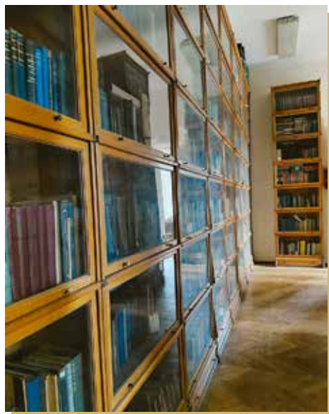
A könyvtárban az eredeti Lingel szekrényekben őrzik a könyveket

Nagyon szépek az épület folyosóit és lépcsőit kísérő régi korlátai, az eredeti ajtókeretek, pad-