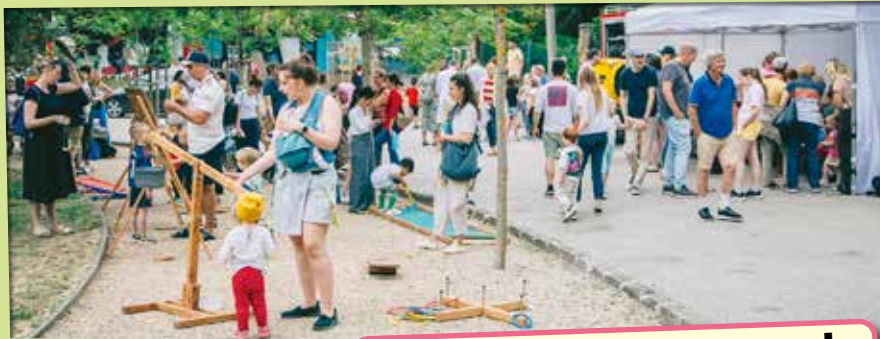
Pasaréti Fenyves park