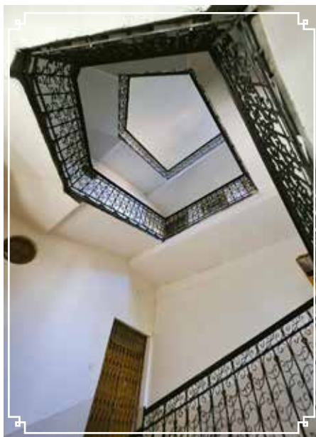
A gang és a lépcsőház megőrzött, eredeti részletei