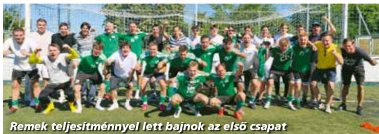
Remek teljesítménnyel lett bajnok az első csapat