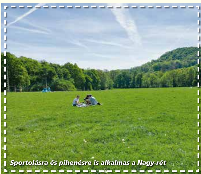
Sportolásra és pihenésre is alkalmas a Nagy-rét

Kerületünk Szépvölgy városrésze nevében is osztozik az erdőterülettel. Régóta a kirándulók kedvelt célpontja, hiszen az Árpád-kilátóból egyedülálló panoráma nyílik, itt öröklik az Oroszlán-szikla, Macis játszótéred pedig megunthatatlan. Régi murvás parkolójának jó részét is sikerült már visszaerdősíteni.