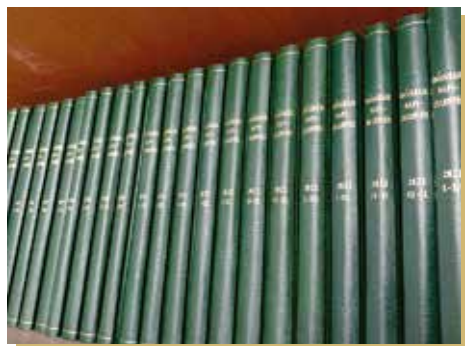
1893 júliusa óta minden Napijelentés megvan kötetbe fűzve

lóburkolatok és a megfigyelőtoronyba felvezető, vasból készült csigalépcső is. A székházba már eredetileg is terveztek múzeumi funkciót, ma a folyosókon elhelyezett tárlókban nagyon sok izgalmas régi műszert és más, a meteorológiához kapcsolódó tárgyat találhatunk. Szerepelnek itt magaslégtörő és földfelszíni műszerek, csillagászati és egyéb eszközök, emléktárgyak, díjak, kitüntetések, fotók, szekrény nagyságú, mázsás ionszondák, de még jégeső-elhárító rakéták is. Egykor a múzeumon, dolgozószobákon, laboratóriumokon és megfigyelőhelyeken túl lakásokat is kialakítottak az épületben.