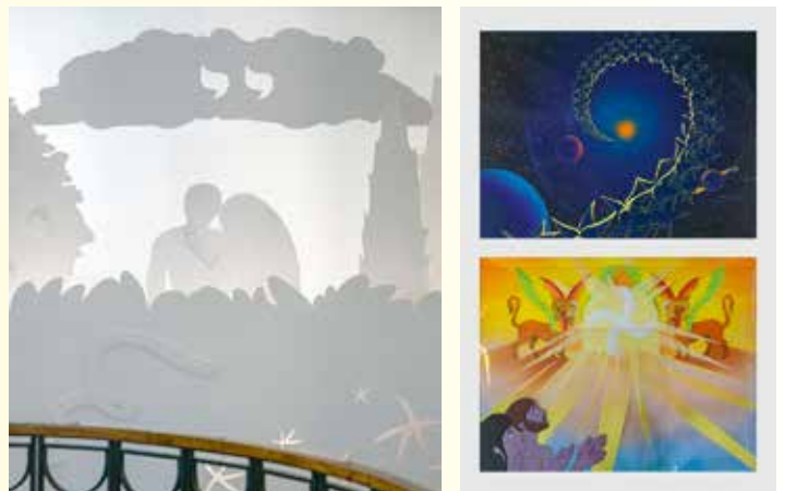
A kiállításon a teremtéstörténetet idéző installáció és a filmhez készült rajzok is láthatók

Magyarország legnagyobb, sőt a világ egyik legnagyobb rajz-, animációs- és szinkronfilmstúdiója volt, amely most újra egy fontos kulturális helyszínné válik” – mondta. Érdekesség, hogy a most megnyílt kiállításon belül látható az a fal is, amelyen megőrizték az itt alkotó egykori nagyságok aláírásait.