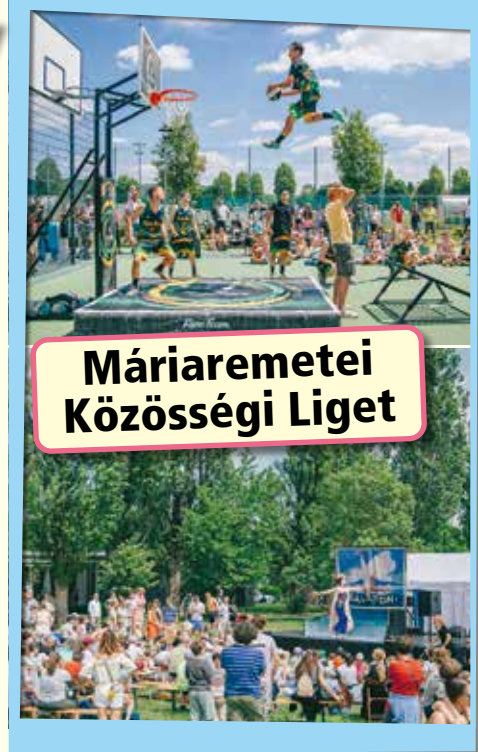
Máriaremetei Közösségi Liget