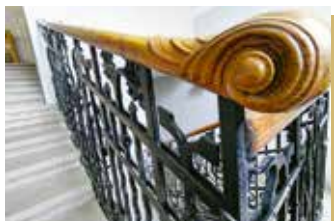
Sok apró részlet tanúskodik még az épület egykori igényes kialakításáról

„A munka szentélye ez, ahol csendben és feltűnés nélkül művelik a jövő legfontosabb és legérdekesebb tudományát – az időjárását” – írta róla egykor a Vasárnapi Újság, és így van ez ma is.