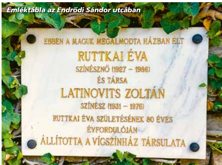
Emléktábla az Endrődi Sándor utcában