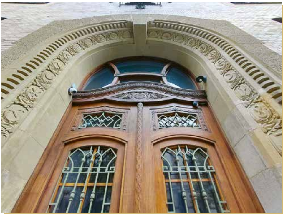
A bejárat körül egykor használatos meteorológiai ikonokat láthatunk