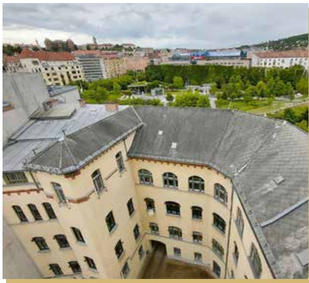
A megfigyelőteraszról kivételes panoráma nyílik Budára