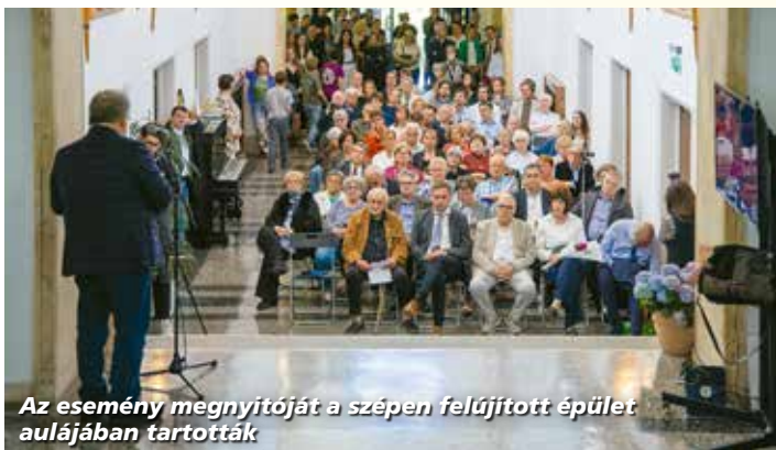
Az esemény megnyitóját a szépen felújított épület aulájában tartották