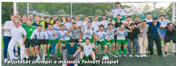
Feljutását ünnepli a második felnőtt csapat

Az első csapat is joggal ünnepelhetett, ugyanis a BLSZ II. utolsó fordulójában 1:0-ra nyertek, amivel megszerezték a bajnoki címet, és feljutottak a BLSZ I. osztályba. A csapat fantasztikus tavaszi szezont zárt, 41 pontot szerzett, csak 4 gólt kapott, miközben 12 mérkőzésen maradt érintetlen a hálója.