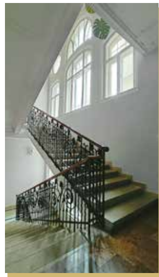
A lépcsőház vaskorlátjai még a régiek