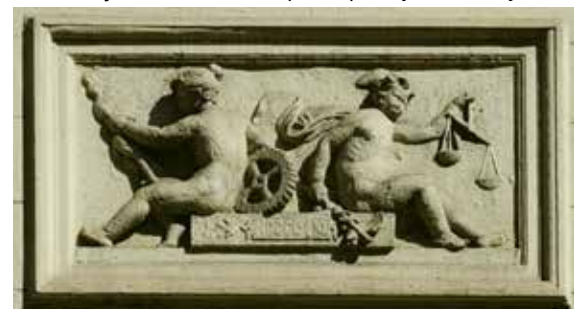
A homlokzaton a kereskedelem allegóriái