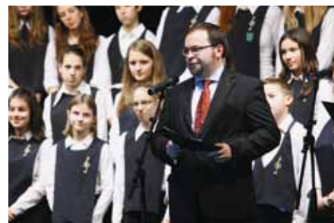
Az este díszvendége Renatas Juška, a Litván Köztársaság magyarországi nagykövete volt

A litván Nemzeti M. K. Čiurlionis Művészeti Iskola Ifjúsági Kórusának karnagya, Romualdas Gražinis lapunknak elmondta, hogy bár a kórus most először lép fel Magyarországon, ő már járt Budapesten, amit egy csodálatos városnak ismert meg.