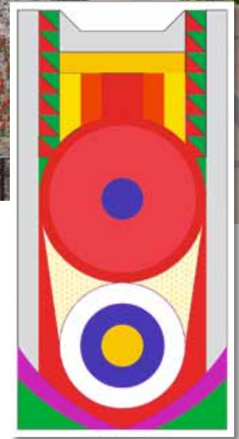
A Mechwart liget 2013-as virágültetési terve felülnézetből