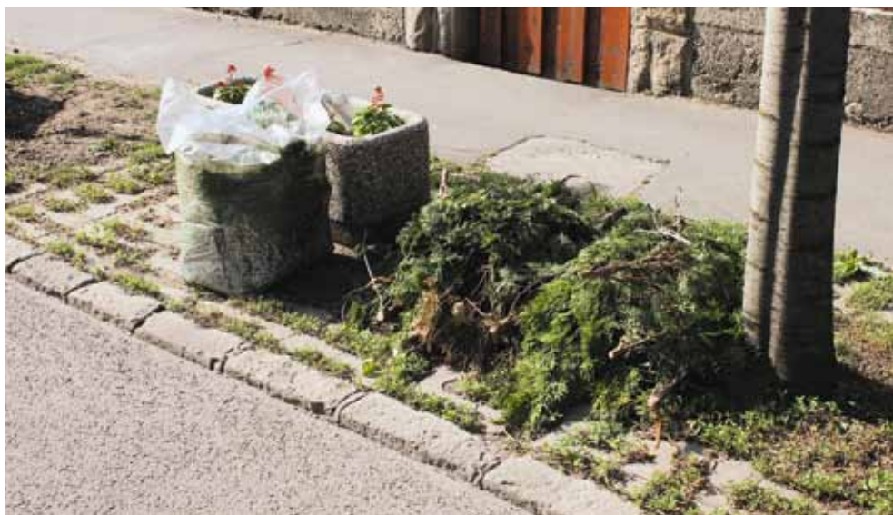
Az FKF Zrt. a kötegelt faágakat csak abban az esetben szállítja el, amennyiben melléhelyeznek, illetve ráerősítenek kötegenként egy logóval ellátott kerti zöldhulladék-gyűjtő zsákokat