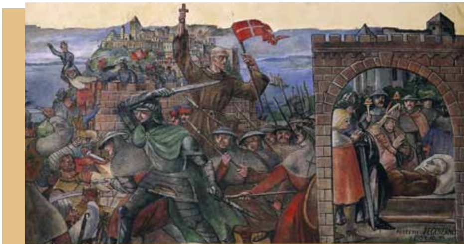
Az 1949-ben felszentelt Tövis utcai templom védőszentjéül a pogányság elleni harc hőseit, Kapisztrán Szent Jánost választották. A felszentelést követően nem sokkal feloszlatták a rendeket. A templomot kortárs egyházművészet legjelesebb alkotóinak (Molnár C. Pál, Pleidell János, Jeges Ernő, Metky Ödön, Búza Barna, Kontuly Béla, Fuchs Hajnalka) falfestményei, szobrai és üvegablakai ékesítik a rózsadombi templomot. A karzat mellvédjén található, Kapisztrán életét bemutató szekskót (képünkön) Jeges Ernő festette.

A magyar rendek még 1452-ben Magyarországra hívták Kapisztrán Jánost Isten ígéjének hirdetésére, de ez a megbízatása hamarosan megváltozott: rá hárult a keresztesek toborzása. Délvidéken kapta kézhez III. Kallixtus pápa levelét, amelyben megbízta, hogy hirdesse meg Magyarországon a török elleni keresztes hadjáratot. 1456 februárjában Carvajal bíboros a budai vár templomában átadta neki a pápától küldött keresztet. A közel hetvenéves ferences szerzetes, Kapisztrán János a magyar ferencesek egy kis csoportjával áprilisban indult el Budáról, hogy több mint két hónapon át Baranya, Bács, Bodrog és Csanád megyében kereszteseket toborozzon. Kiváló szónok volt. Nem csoda, hogy tömegesen csatlakoztak hozzá.