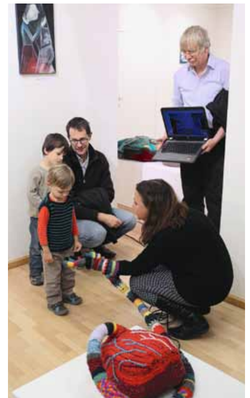
Rutkai Bori különleges szerkezete a bánatot szívja ki a szomorú szívekéből