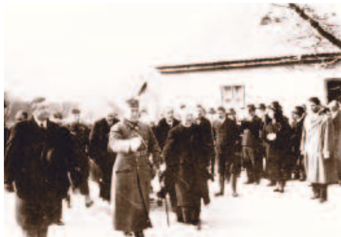
A hősi emlékmű 1925-ös avatásán: gróf Klebelsberg Kuno és József főherceg

HIDEGKÚTI POLGÁR — A Budai Polgár Adyligeten, Budakeszi-erdőn, Budaligeten, Erzsébetligeten, Erzsébetteleken, Gercsén, Kóváron, Máriaremetén, Pesthidegkút—Ófalun, Petneházyréten, Remetekertvárosban és Széphalmon terjesztett melléklete. Megjelenik 8000 példányban.