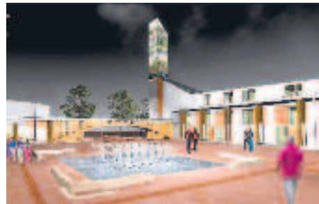
A véleményüket kinyilvánító hidegkútiaknak a Varázskapu koncepció tetszett legkevésbé

cai sportpálya területének jövőbeni fejlesztéséről mondhattak véleményt. A kampány sikeressége minden előzetes várakozást felülmúlt, és bebizonyosodott, hogy a hidegkútiaknak kiemelten fontos a terület jövője, az elmúlt évtizedekben felhalmozódott gondolataikat pedig örömmel osztják meg a döntéshozókkal. Január 24. és február 15. között ezren nézték meg a www.megujulhidegkut.info honlapot, és közel ugyanennyien keresték fel a helyszíni információs pontot.