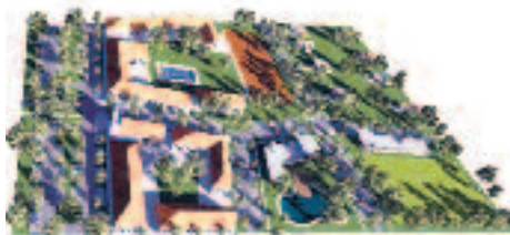
A Szépliget-terv tetszési indexe a második helyhez volt elegendő