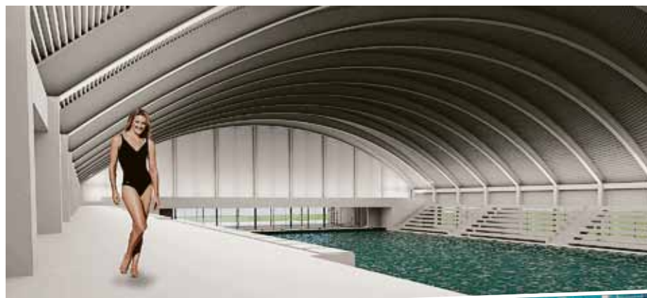
Az uszoda medencéi vízilabdaedzések helyszínül is szolgálnak majd

– a gyerekek 61%-a szintén hetente többször, 26%-a hetente egyszer, 10%-a naponta elmenne az uszodába, vagyis az uszodába járni kívánó gyerekek közül 97% hetente legalább egyszer megjelenne ott.