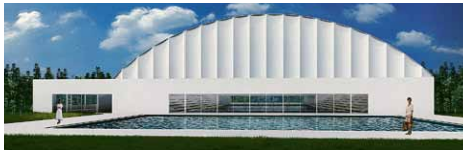
A pesthidegkúti uszoda épületének külső látványterve

Az önkormányzat képviselő-testülete április 28-i ülésén úgy határozott, hogy élni fog a társasági adóról szóló törvény által biztosított lehetőséggel, és idén igénybe veszi a látványcsapatsportok támogatásának adókedvezményét. Ennek köszönhetően uszoda épülhet Máriaremetén, melynek elkészülte teljessé teheti a Pokorny József Sport- és Szabadidőközpontot is magába foglaló sportcentrumot.