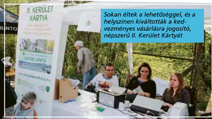
Sokan éltek a lehetőséggel, és a helyszínen kiváltották a kedvezményes vásárlásra jogosító, népszerű II. Kerület Kártyát