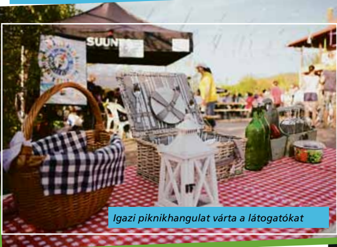
Igazi piknikhangulat várta a látogatókat

Április 25-én szombaton, csodaszép, napsütéses tavaszi délutánon rendezték meg a II. Hidegkúti Családi Pikniket, amelyhez a helyszínt – folytatva a tavaly megkezdett hagyományt – ismét a Geli Lakberendezési Ház biztosította.