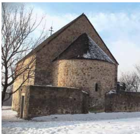
Bognár Lajos atyának köszönhetjük, hogy romjaiból újjáépült a gercsei templom